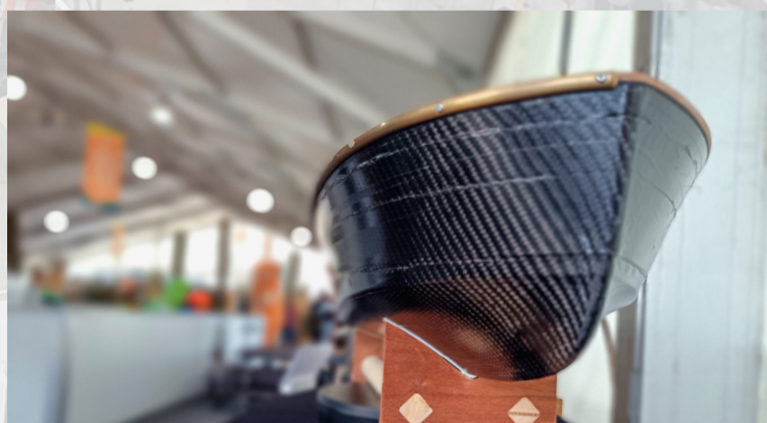
Das Modellboot, welches in der Meisterschaft hergestellt werden sollte