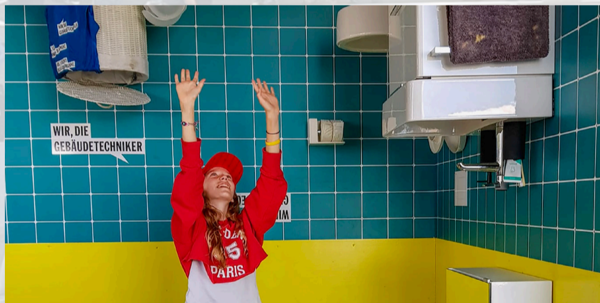
Berufe hautnah erleben – die Welt steht Kopf bei den Sanitärinstallateuren.