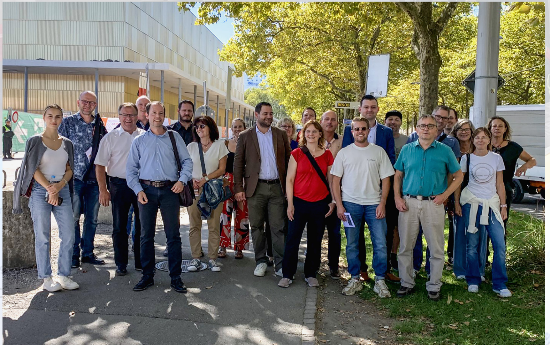
Der Gewerbeverein Reichenbach und der Gewerbeverband Spiez haben bereits seit längerem Initiativen für die Berufsbildung ergriffen. Dementsprechend guten Anklang fand auch der gemeinsame Ausflug an die SwissSkills.