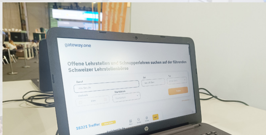
Geeignete Berufe können über die Lehrstellen-App gesucht werden.